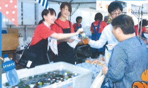
名物“横田カレー”美味しいよ～